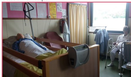
Classe de soins aux personnes

Les étudiants inscrits dans l'option AAA auront l'occasion, durant leurs stages, d'expérimenter le travail dans un cabinet d'avocats, dans une administration communale ou dans les différents services d'une entreprise privée ou publique suscitant parfois des vocations. En effet, à l'issue de leur cursus, les élèves de GTPE obtiennent leur certificat de qualification et peuvent démarrer une carrière indépendante ou poursuivre des études supérieures.