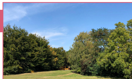
Un vaste espace vert pour se ressourcer