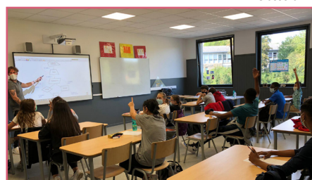
Classe équipée de tableau interactif